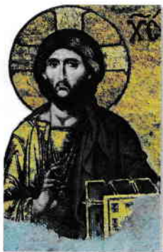
■ Iisus Hristos, mozaic, Sfânta Sofia, Constantinopol

Israel sau Țara Sfântă este pământul făgăduit de Dumnezeu lui Moise și locul unde S-a născut Mântuitorul nostru Iisus Hristos, Mesia cel mult așteptat. Aici, El și-a desfășurat activitatea publică, propovăduind neobosit Împărăția lui Dumnezeu, pentru mântuirea noastră, a tuturor.