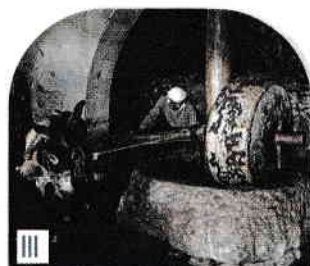
Piatră de moară folosită la presarea măslinelor pentru obținerea uleiului