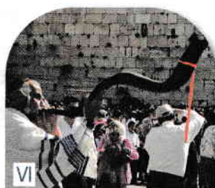
Rugăciune la sărbătoarea Pesah (Paște), suflător din șofar (corn de berbec – folosit în muzica de cult)