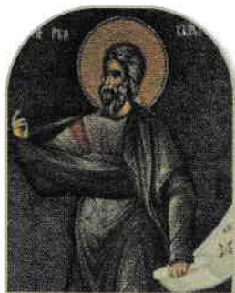
1. Profetul Isaia