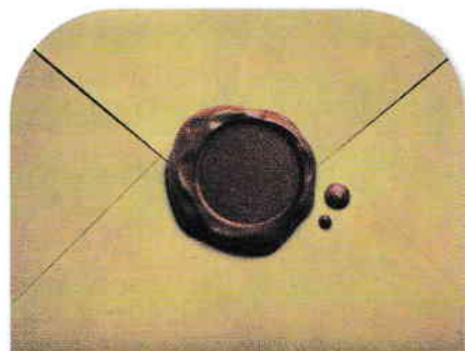
Plic pentru scrisoare