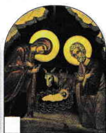
1. Botezul Domnului 2. Rugăciunea lui Iisus 3. Pescuirea minunată 4. Jertfa Domnului 5. Schimbarea la Față 6. Nașterea Mântuitorului

2 Realizează o hartă a Țării Sfinte sau accesează manualul digital și descarcă fișa care conține harta alăturată.