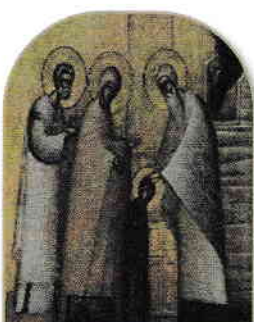
5. Părinții Ioachim și Ana