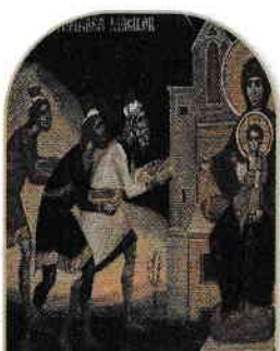
4. Cei trei magi