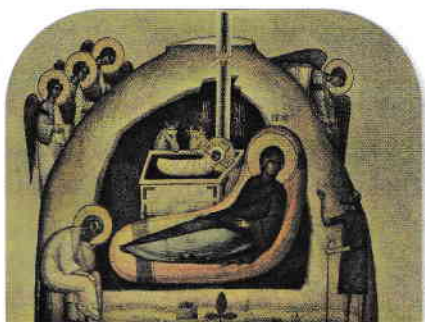
Icoana Nașterii în peșteră

4 Analizează imaginile de mai jos, apoi rezolvă cerințele.