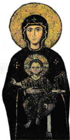
■ Fecioara Maria, mozaic, Sfânta Sofia, Constantinopol