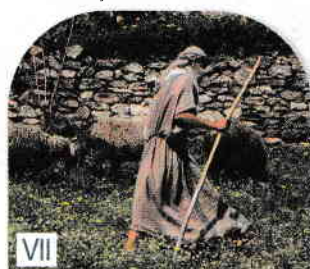
Păstor cu oile la pășunat