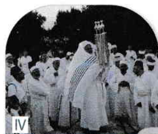
Șavot – sărbătoarea primirii Legii (Tora)