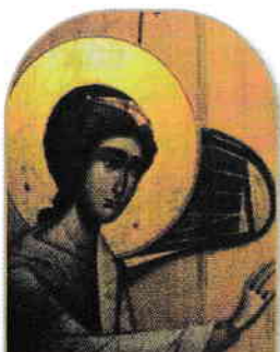
3. Îngerul Gavriil