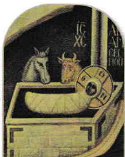
2. Nașterea Pruncului Sfânt