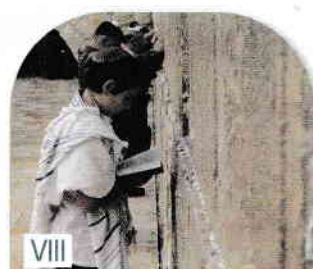
Rugăciune la Zidul de Vest al Templului sau Zidul Plângerii

4 Poporul evreu utiliza ca formule de salut următoarele expresii, prin care invoca numele lui Dumnezeu: Dumnezeu să fie cu tine!, Dumnezeu să aibă milă de tine!, Pace! (Șalom lekha) , iar ca salut la despărțire folosea Mergi în pace!